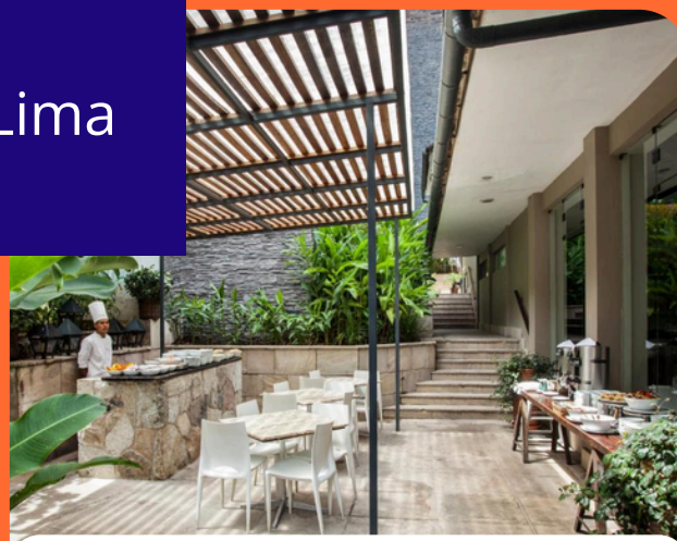
El Mapi Hotel Machu Picchu