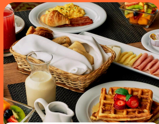
Hotel Estelar Miraflores Lima