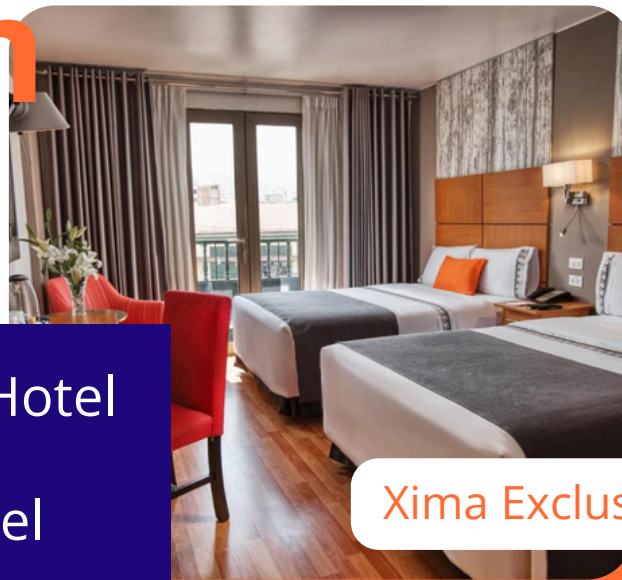
Xima Exclusive Cusco Hotel